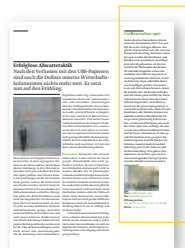
1/3 Seite, 4-farbig

Präsentieren Sie Ihre Neuheiten in unserer Rubrik «Publireportagen». Sie liefern uns Text und Bildmaterial. Das Redigieren, Setzen und Gestalten übernehmen wir für Sie. Nutzen Sie das kompetente redaktionelle Umfeld und präsentieren Sie Ihre Firma, Ihre Produkte, Ihre Dienstleistungen in Form einer «Publireportage».